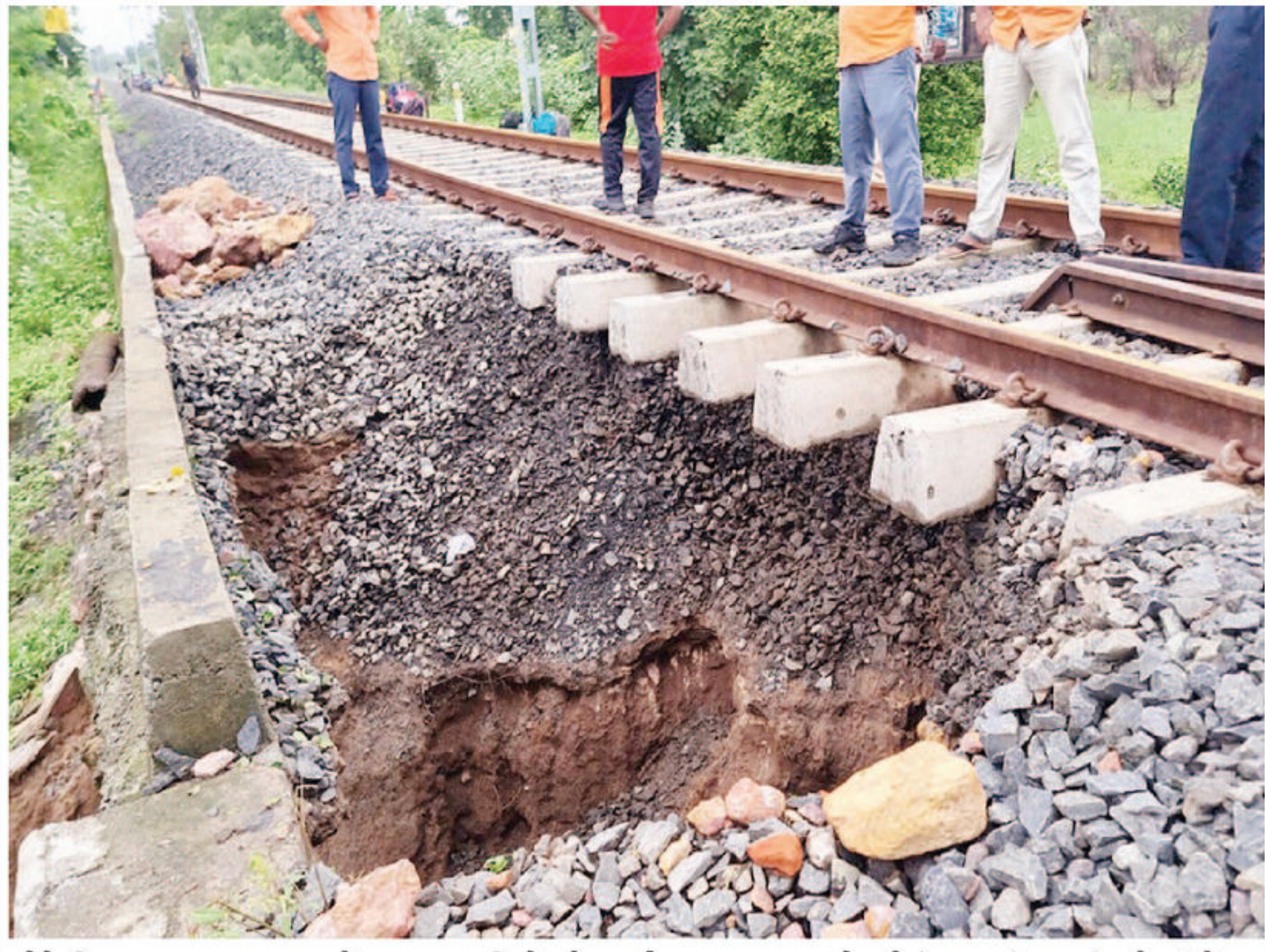
બોડેલી તાલુકા પાટણા ગામે પસાર થતી રેલવે લાઈનના નાળા પાસે મોટું ગાબડું પડતાં છોટાઉદેપુર છુછાપુરા રેલવે લાઈન વ્યવહાર બંધ કરાયો હતો.