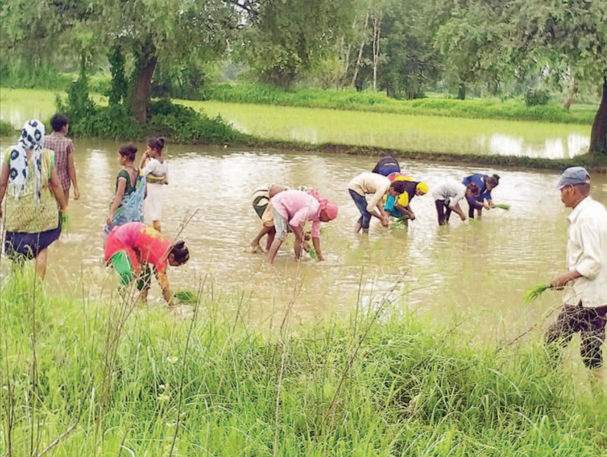
હાલોલ તાલુકામાં એક સપ્તાહથી સતત વરસાદ થતા ખેડૂતો ખેતરોમાં ડાંગરની રોપણીનું કામ આરંભી દીધું છે.

હાલોલ તા.૧૯ | હાલોલ તાલુકામાં છેલ્લા એક સપ્તાહથી થયેલા સતત વરસાદને પગલે ધરતી પુગી દ્વારા ખેતરોમાં પાણી ભરાતા ખેતી કામમાં જોતરાયેલા જોવા મળે છે. રોપણી માટે ખેડૂતોમાં ઉત્સાહ જોવા મળ્યો ભારે ડાંગરની રોપણી કરવા માટે ખેતરોમાં પાણી ભરાવવા જરૂરી હોય છે. હાલોલ તાલુકાના ખેતરોમાં ડાંગરની રોપણીને લાયક પાણી ભરાતા ધરતી પુગી દ્વારા ડાંગરના ધરતી રોકણી કરવામાં આવી રહી છે. પાણી ભરાયેલા ખેતરોમાં ચારે કોર ખેડૂતો દ્વારા ડાંગરની રોપણી મોટાપાયે કરવામાં આવી રહી છે. ડાંગરની રોપણી માટે ખેતરોમાં પાણી વધુ પ્રમાણમાં જોઈતું હોય ખેડૂતોને તે પાણી પૂરતા પ્રમાણમાં મળી ગયું હોય ખેડૂતો દ્વારા ઉત્સાહભરે રોપણીની કામગીરીમાં જોતરાયા હતા.