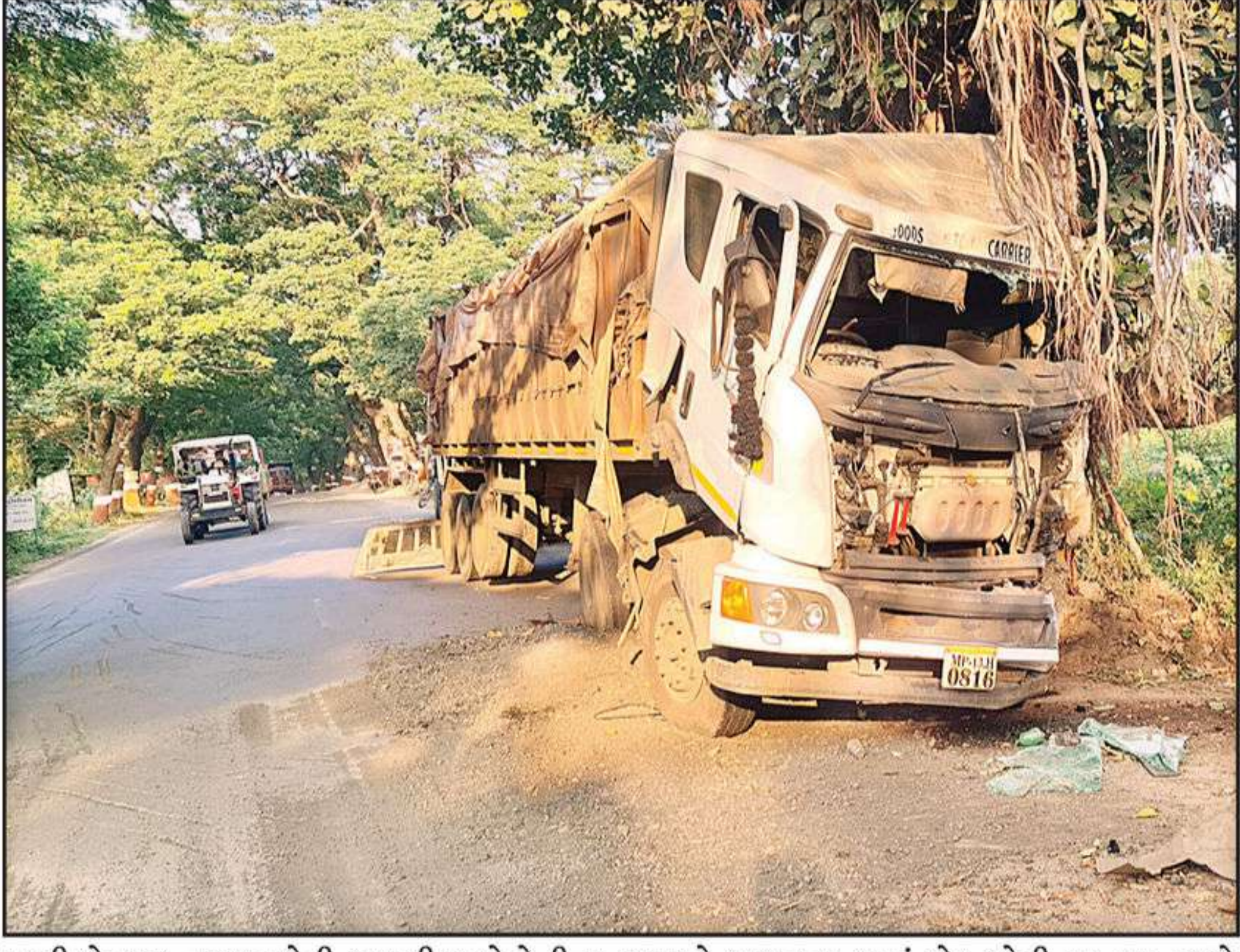
પાવી જેતપુર નજીક મોટી રાસલી પાસે રેતીના ડમ્પરને બચાવવા જતાં એક મોટી ટ્રક વૃક્ષ સાથે અથડાઈ હતી