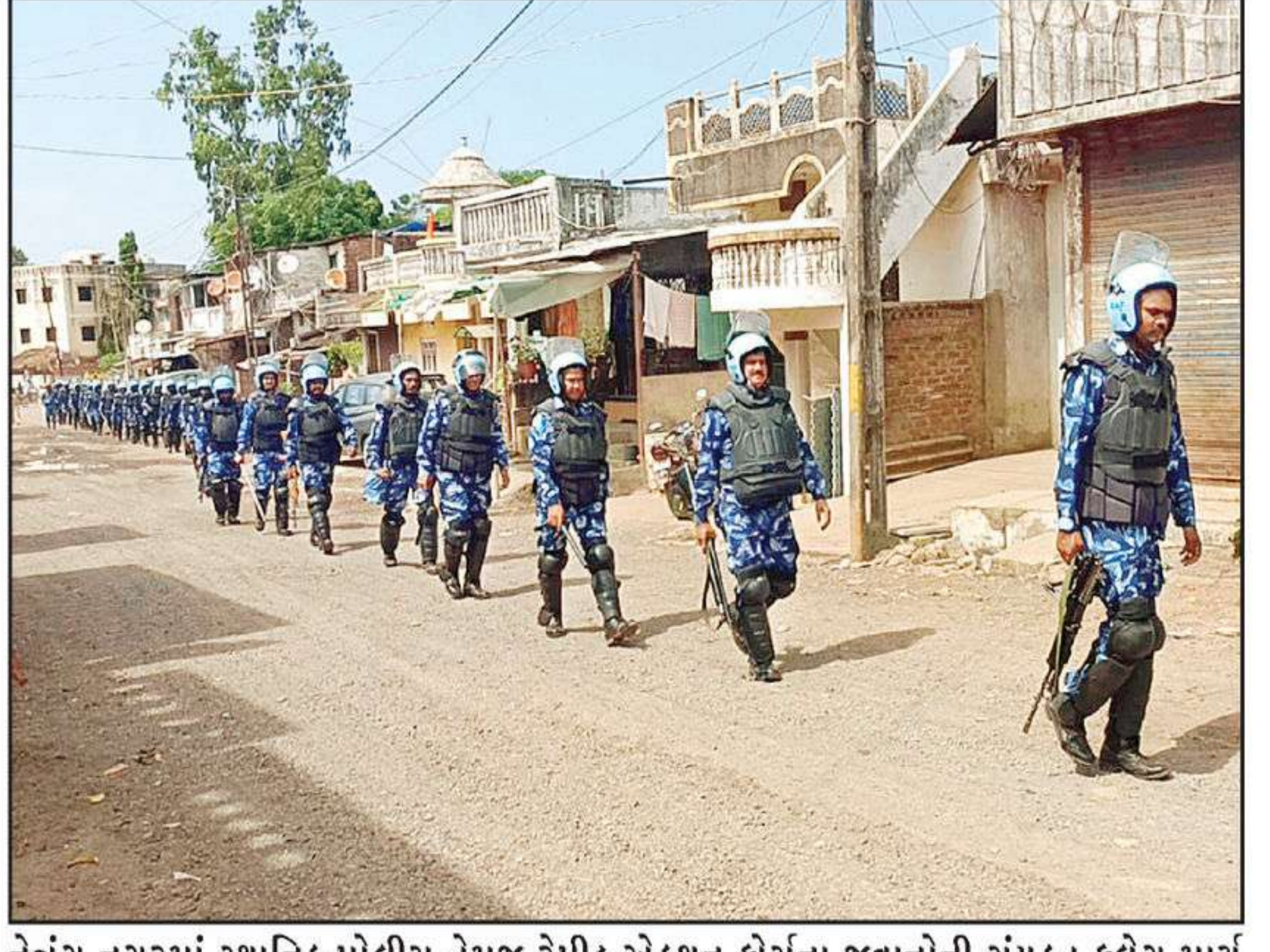
નેત્રંગ નગરમાં સ્થાનિક પોલીસ તેમજ રેપીડ એક્શન ફોર્સના જવાનોની સંયુક્ત ફ્લેગ માર્ચ યોજાઈ હતી.

ગઢવેલ ગામે નિશાળ ફળિયામાં આવેલી કોતરના કિનારે આવેલા ઝાડી ઝાંખરામાંથી મહિલાએ નવજાત શિશુને મરવા માટે ત્યજી દઈ ફેરાર થઈ હતી. જેથી આ નવજાત બાળક રડવા લાગતાં તેનો અવાજ ત્યાંથી પસાર થનાર લોકોને સંભળાતા સ્થળ પર નજીક જઈ જતા એક નવજાત બાળકનો રડતો હોવાનું નજરે પડ્યું હતું. આ અંગેની જાણ ગઢવેલ ગામના સરપંચને કરવામાં આવતા તેઓ સ્થળ પર દોડી આવ્યા હતા આ મામલે ધાનપુર પોલિસને જાણ કરતા ધાનપુર પોલિસ સ્થળ પર દોડી આવી નવજાત બાળકનો કબ્જો લઈ બાળકને પ્રાથમિક તબક્કે ધાનપુર સરકારી દવાખાને મોકલી આપી આ સંદર્ભે પોલિસે અજાણી વ્યક્તિ વિરુદ્ધ ગુનો નોંધી કાર્યવાહી હાથ ધરી છે.